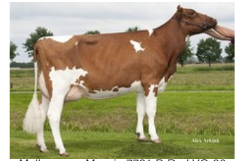
Mellencamp Massia 7731 P-Red VG-86