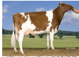
Willem's Hoeve Marcia 4815 P VG-85