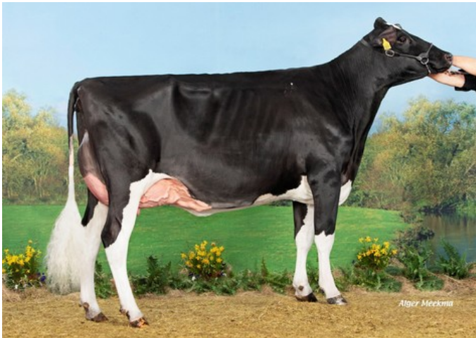
Koepon Splendido Lisa 29 PP VG-87