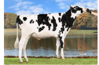
Same family: Koepon Showking

Skat P RDC x Ranger-Red x GP-83 AltaTop-Red x GP-83 Salvatore Rc x VG-86 Silver x VG-87 Man-O-Man x VG-85 Jeeves x VG-85 Shottle x VG-86 Simon x VG-86 Merrill