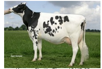
Koepon Shottle Classy 16 VG-85