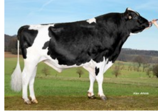
Same family: Koepon Beatclub