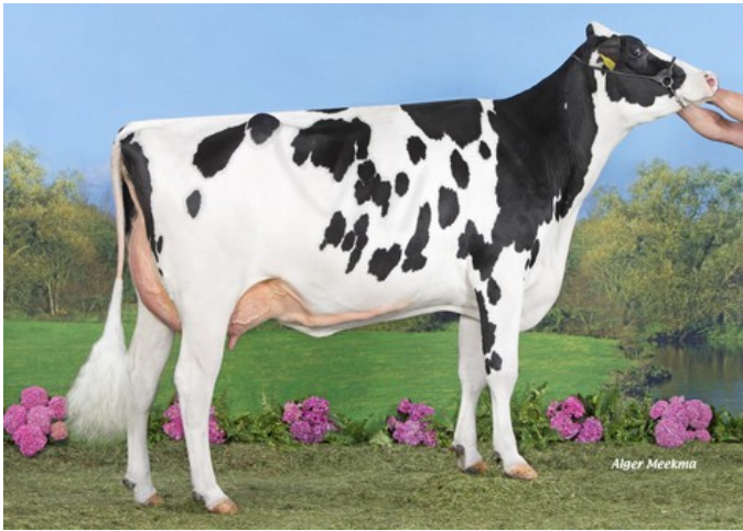
Koepon Slvr Classy 228 VG-86