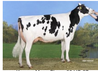
Koepon Mano Classy 93 VG-87