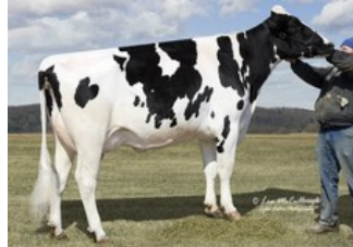
Gold-N-Oaks S Marbella VG-89