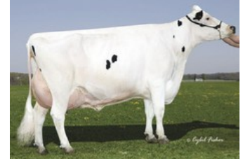
Gold-N-Oaks Morty Malibu EX-94

Boero RF x Freestyle-Red x GP-84 Riveting x EX-91 Superhero x Silver x GP-82 Supersire x VG-87 Bookem x VG-88 Man-O-Man x VG-89 Shottle x EX-94 Morty