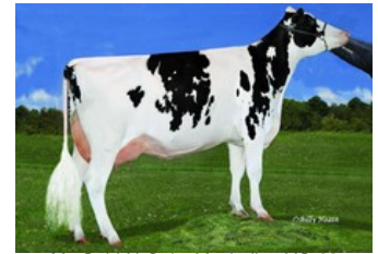
Ms Gold-N-Oaks Maybaline VG-88