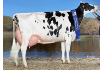
KHE Iowa EX-92, full sister to KHE Island