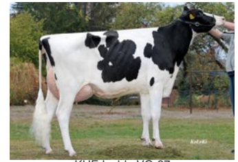
KHE Isolde VG-87