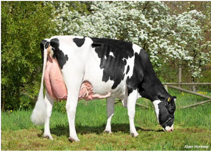
KHE I'm Good VG-87