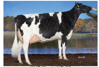
KHE Illinois VG-88