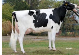
KHE Isolde VG-87