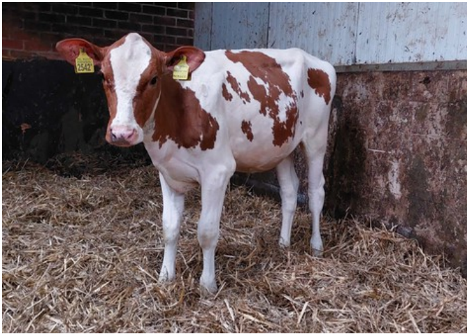
Poppe 3STAR Glennis P Red