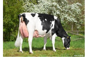
KHE I'm Good VG-87

Member PP Red x Star P RDC x Durable x VG-87 Gymnast x VG-87 Rubicon x VG-89 Shotgun x VG-88 Windbrook x VG-88 Jeeves x VG-85 Goldwyn x VG-85 Juror Ford