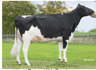
Poppe K&L Gorgina