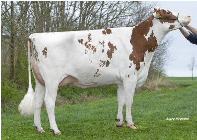
Lakeside Ups Red Range VG-86