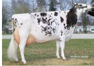
DT Spottie EX-93 (s. Derry), same family