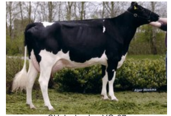
SH Jocko Jen VG-87