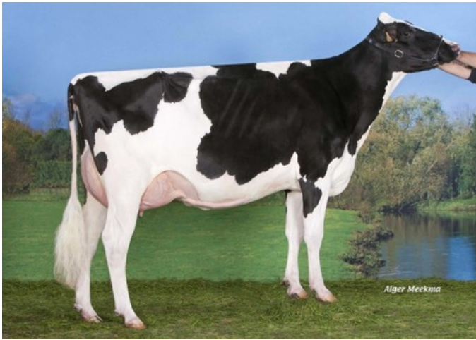
DKR Bayla VG-86