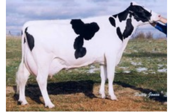
Sunnylodge Prelude Spottie VG-87

Cumulus x Perfect x VG-86 Charl x Hotshot x VG-85 Chevrolet x VG-86 Garrett x VG-87 Shottle x VG-87 Jocko x VG-87 Rudolph x VG-85 Grand