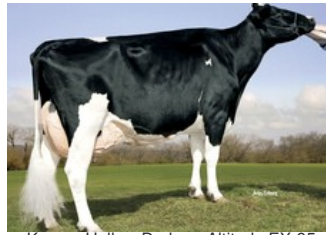
Kamps-Hollow Durham Altitude EX-95