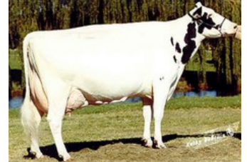
D-R-A August EX-96

Rammstein Red x VG-86 Solitair P Red x Alaska Red x VG-85 Salsa RC x VG-87 Supersire x VG-85 Alexander x EX-91 Goldwyn x EX-95 Durham x EX-93 Prelude x EX-94 Jubilant RF