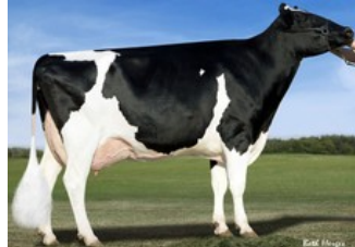
KHW Goldwyn Aiko RDC EX-91