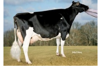
Kamps-Hollow Durham Altitude EX-95

Cartoon P Red x VG-86 Solitair P Red x Alaska Red x VG-85 Salsa RC x VG-87 Supersire x VG-85 Alexander x EX-91 Goldwyn x EX-95 Durham x EX-93 Prelude x EX-94 Jubilant RF