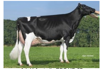
A-L-H Australia RDC VG-87