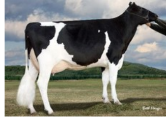
KHW Goldwyn Aiko RC EX-91