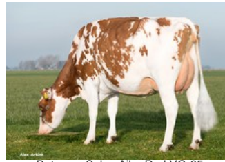
Batouwe Salsa Aiko Red VG-85