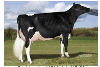
Cookiecutter MOM Halo VG-88