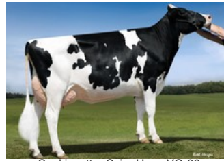
Cookiecutter Ssire Have VG-86