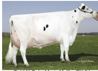
Gold-N-Oaks Morty Malibu EX-94