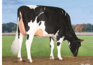
Pen-Col Superhero Mistral EX-91