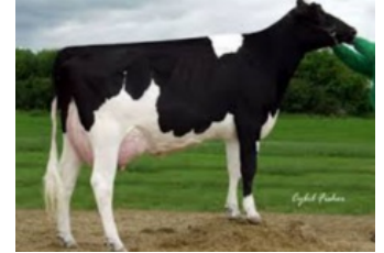
Orthoapple Marshall Alia VG-89

Rainow x Bali x VG-86 Gymnast x VG-86 Supershot x VG-85 McCutchen x VG-87 Altalota x VG-87 Planet x EX-92 Bolton x VG-87 Forbidden x VG-89 BW Marshall