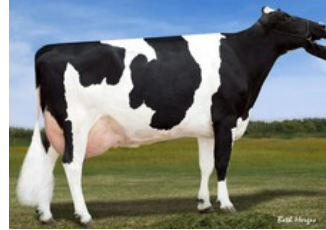
Sandy-Valley Bolt Sheila EX-92