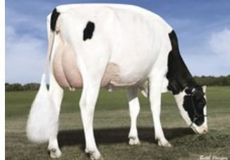
Des-Y-Gen Planet Silk EX-90