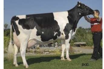
Gen-I-Beq Durham Sherry VG-87

Trumpet-Red x Rubels-Red x GP-84 Salvatore Rc x Rubicon x GP-83 Cashcoin x VG-87 Snowman x EX-90 Planet x VG-85 Bolton x VG-87 Goldwyn x VG-87 Durham