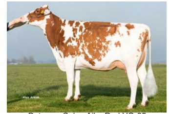
Batouwe Salsa Aiko Red VG-85