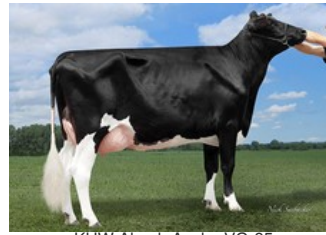
KHW Alxndr Ayako VG-85