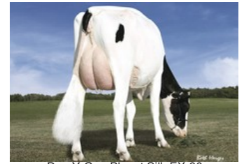
Des-Y-Gen Planet Silk EX-90