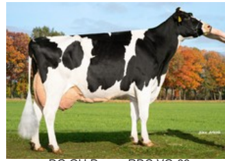
DG OH Donna RDC VG-89