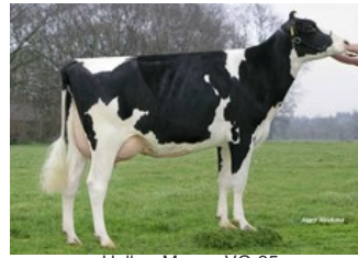
Holbra Manoa VG-85