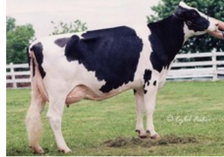
Mayerlane-DK Hiawatha EX-90