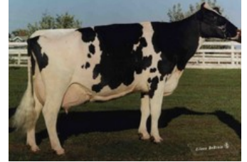
Golden-Oaks Mark Prudence EX-95

Altawheelhouse x GP-83 Charl x VG-85 Altatopshot x VG-89 Rubicon x GP-83 Aikman RDC x VG-85 Man-O-Man x VG-87 Mascol x VG-88 Durham x EX-90 Rudolph x EX-95 Chief Mark