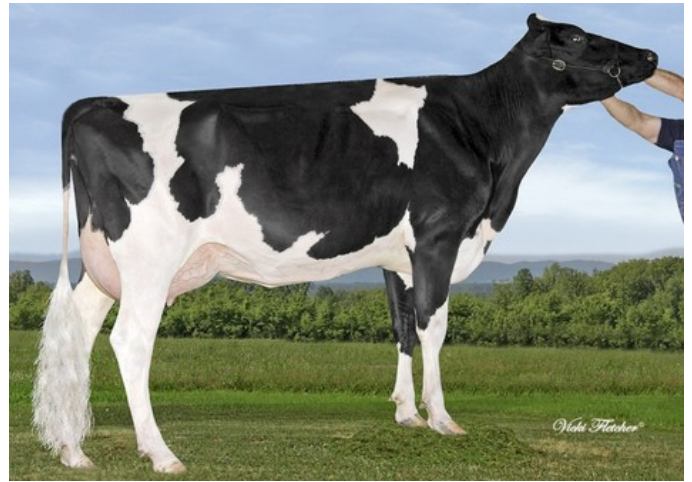
Gen-I-Beq Bolton Silence VG-85

Camden x Rubels-Red x GP-84 Salvatore Rc x Rubicon x GP-83 Cashcoin x VG-87 Snowman x EX-90 Planet x VG-85 Bolton x VG-87 Goldwyn x VG-87 Durham