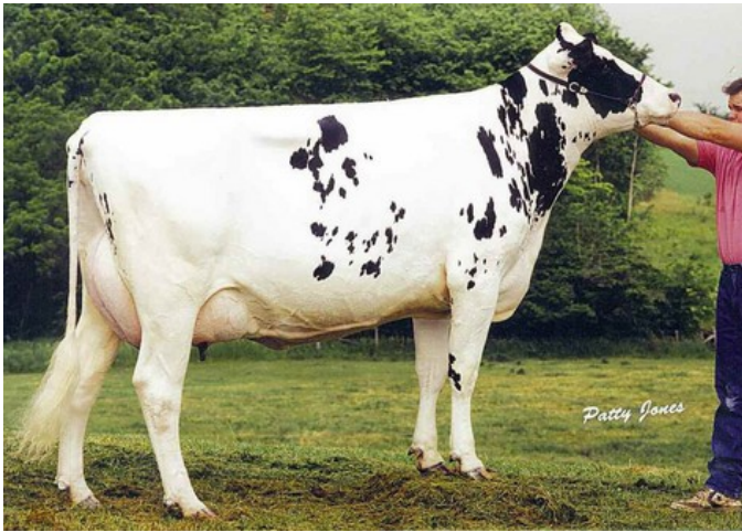
Glen Drummond Shower EX