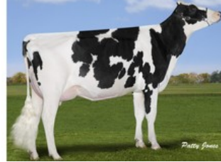
Gen-I-Beq Snowman Summer RDC VG-85