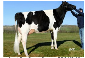
Gen-I-Beq Bolton Secretly RDC VG-87