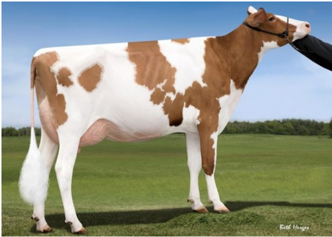
Snowbiz Sympatico Sofia Red VG-85