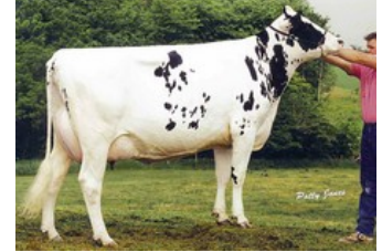
Glen Drummond Shower EX

Ranger-Red x AltaDateline x Rubi-Asp*Rc x Supershot x VG-85 Sympatico RF x VG-85 Snowman x VG-87 Bolton x VG-87 Goldwyn x VG-87 Durham x VG-86 Formation