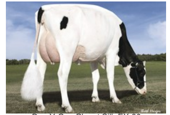
Des-Y-Gen Planet Silk EX-90