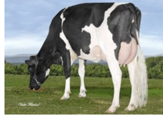
Gen-I-Beq Bolton Silence VG-85