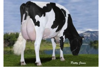
Gen-I-Beq Goldwyn Secret RC VG-87

Sorelio P x Rubels-Red x GP-84 Salvatore Rc x Rubicon x GP-83 Cashcoin x VG-87 Snowman x EX-90 Planet x VG-85 Bolton x VG-87 Goldwyn x VG-87 Durham