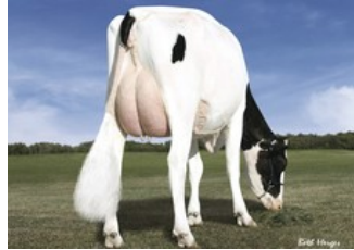
Des-Y-Gen Planet Silk EX-90