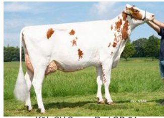
K&L SV Sunny Red GP-84