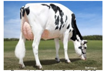
Dymentholm Sunview Sunday VG-87