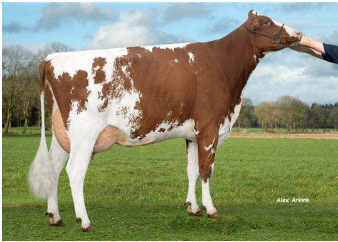
3STAR OH Sunnyside Red