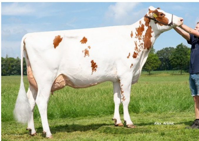
K&L SV Sunny Red GP-84