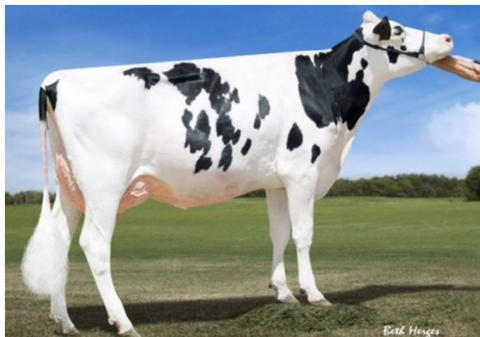
Dymentholm Sunview Sunday VG-87

Freestyle-Red x Rubels-Red x GP-84 Salvatore Rc x Rubicon x GP-83 Cashcoin x VG-87 Snowman x EX-90 Planet x VG-85 Bolton x VG-87 Goldwyn x VG-87 Durham