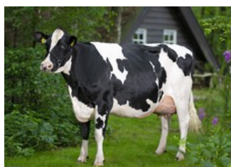
De Oosterhof Dg Rose RDC VG-89