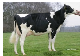
Holbra Manoa VG-85