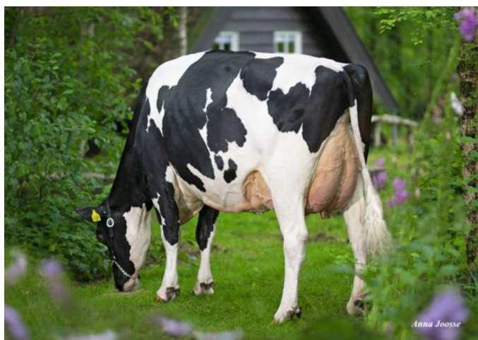
De Oosterhof Dg Rose RDC VG-89