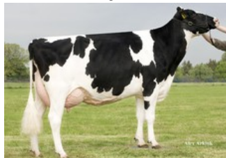
Holbra Mascol Pam VG-87