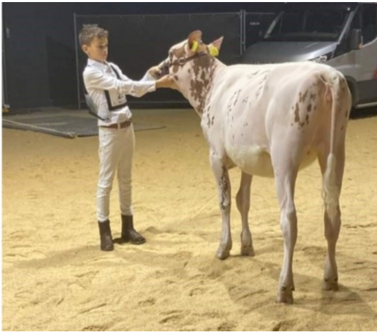
De Wijde Blik Roseanne Red 2