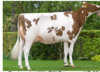
Quatropoint K&L SW Roseanne VG-85