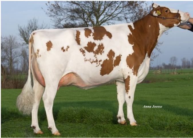
Batouwe Ailisha Salva Red VG-85