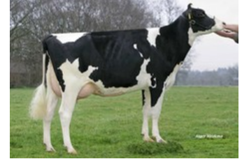
Holbra Manoa VG-85

Crisalis RF x GP-84 AltaAltuve RDC x VG-86 Salvatore Rc x VG-89 Rubicon x GP-83 Aikman RDC x VG-85 Man-O-Man x VG-87 Mascol x VG-88 Durham x EX-90 Rudolph x EX-95 Chief Mark