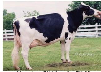
Mayerlane-DK Hiawatha EX-90