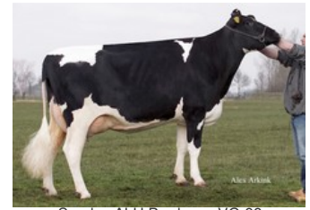
Sunday ALH Prudence VG-88