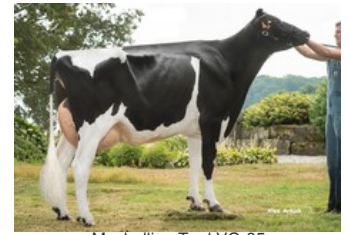
Maybelline Tual VG-85