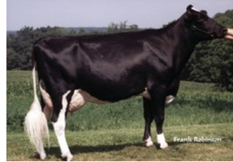
Tolare Rudolph Cupid, zus v Jimtown QP