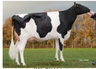
K&L OH Mabel