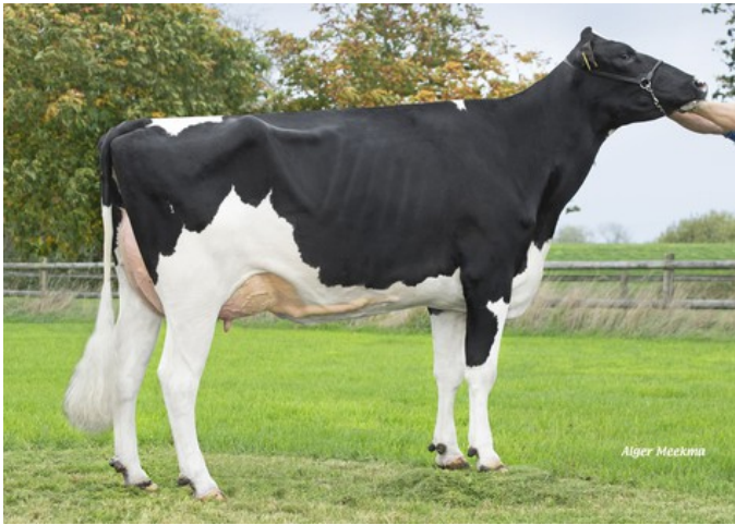
Poppe K&L Gorgina