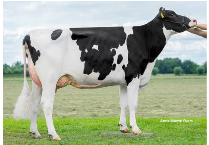
KHE I'm Good VG-87

GP-82 Gladius x Durable x VG-87 Gymnast x VG-87 Rubicon x VG-89 Shotglass x VG-88 Windbrook x VG-88 Jeeves x VG-85 Goldwyn x VG-85 Juror Ford x VG-85 Cleo