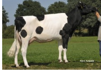
Zandenburg Goldwyn Ebony VG-86