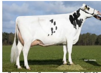
Zandenburg Snowman Ebony 1 EX-90