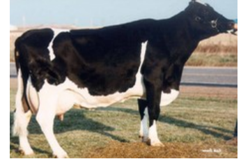
Rocky-Vu Mars Esthe Exctasy VG-87

AltaTop-Red x VG-86 Jacuzzi-Red x VG-88 Finder x Boss x EX-90 Snowman x EX-90 Twister x VG-86 Goldwyn x VG-86 Lancelot x VG-87 Webster x VG-89 Lucky Leo