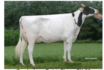
Zandenburg Twist. Ebony EX-90