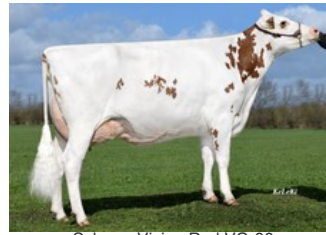
Schreur Vision Red VG-88