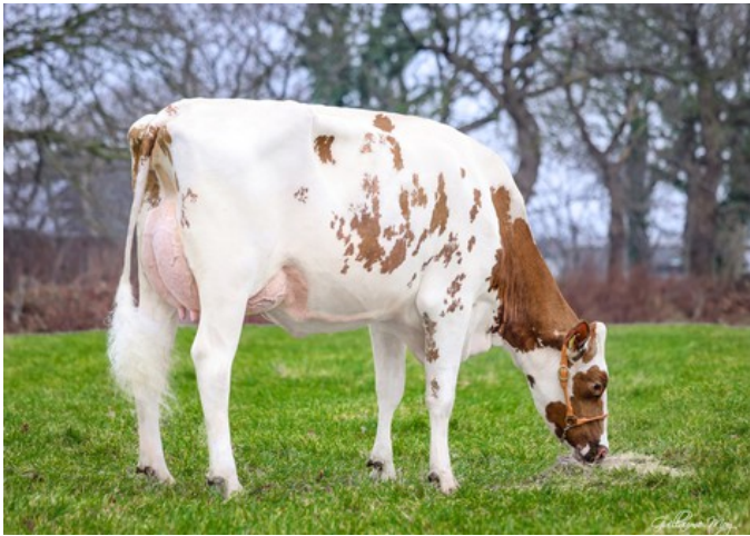
GLH Ronald Aura Red VG-86