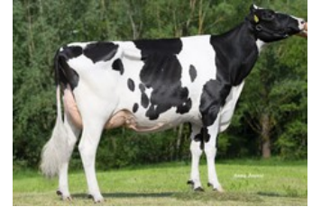
Broekhuis RUW Elite VG-86

GP-83 Vh Crown x VG-87 Cameron x VG-86 Barclay x Molotov x GP-83 Shamrock x VG-85 Man-O-Man x VG-88 Colby x VG-87 Augustine x VG-85 Ramos x VG-88 Manfred