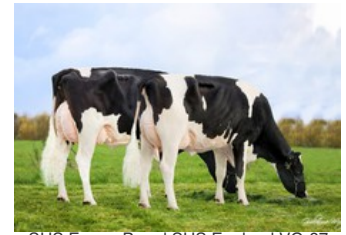
SHS Emma P and SHS England VG-87