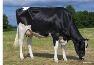
SHS England VG-87