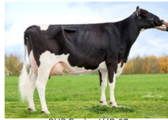
SHS England VG-87