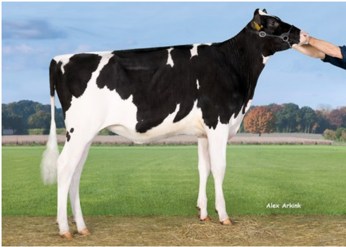
SHS Electra GP-83