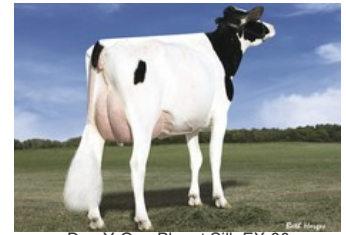
Des-Y-Gen Planet Silk EX-90