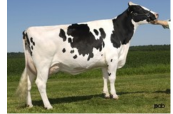
Glen Drummond Splendor VG-86

Rubels-Red x GP-84 Salvatore Rc x Rubicon x GP-83 Cashcoin x VG-87 Snowman x EX-90 Planet x VG-85 Bolton x VG-87 Goldwyn x VG-87 Durham x VG-86 Formation