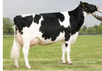
Holbra Mascol Pam VG-87