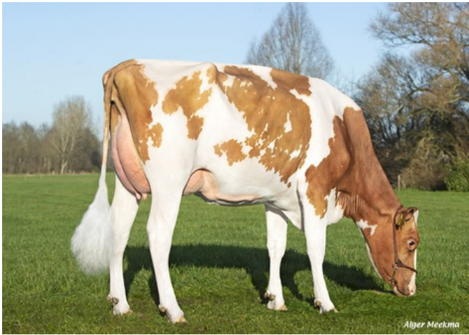
Quatropoint K&L SW Rosita Red GP-84