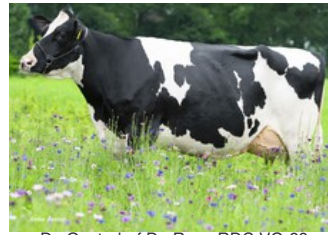
De Oosterhof Dg Rose RDC VG-89