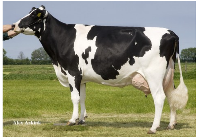
Butemare Veneriete Ida O VG-86

GP-84 Fanatic x VG-88 Shottle x VG-86 O Man x VG-87 Ronald x VG-85 Jabot x VG-85 Curioius x VG-86 Southwind