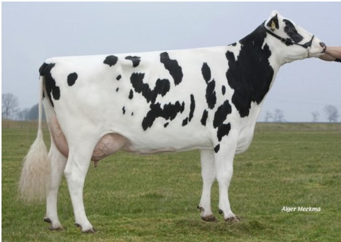
Veneriete Shottle Ida 6 VG-88