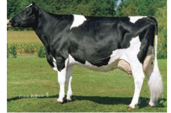
Whittier-Farms Lead Mae EX-95

Skywalker x Modesty x VG-86 Numero Uno x VG-89 Ms Atlees Sht Aftershock x VG-88 Goldwyn x VG-88 Durham x EX-95 Leadman x VG-89 Blackstar x VG-87 Jason x EX-91 Valiant