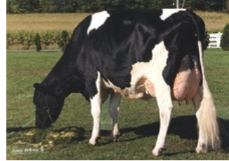
Whittier-Farms Lead Mae EX-95