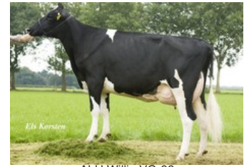
ALH Willie VG-88