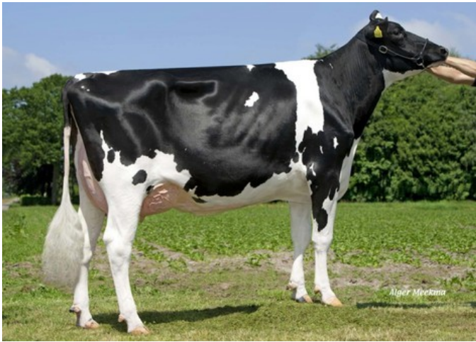
Gevels Willie 1 VG-89