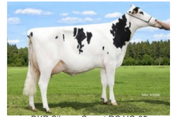
DKR Silence Secret RC VG-85