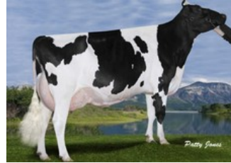
Gen-I-Beq Goldwyn Secret RC VG-87