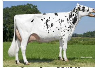
Schreur Serena 7 P VG-85