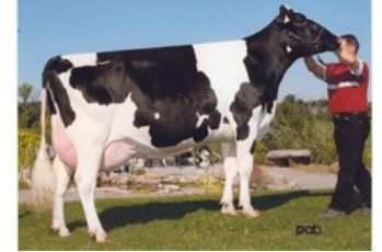
Gen-I-Beq Durham Sherry VG-87

VG-87 Apo Red PP x VG-85 Silver x GP-83 Earnhardt P x GP-82 Colt P x VG-85 Socrates x VG-87 Goldwyn x VG-87 Durham x VG-86 Formation x VG-88 Aerostar x EX Enhancer