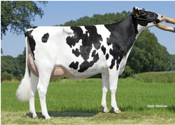
Schreur Serena 13 PP RDC VG-87