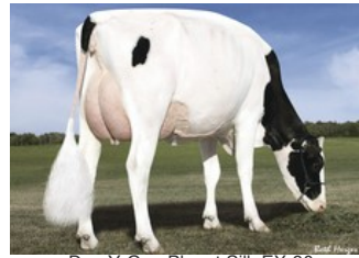
Des-Y-Gen Planet Silk EX-90