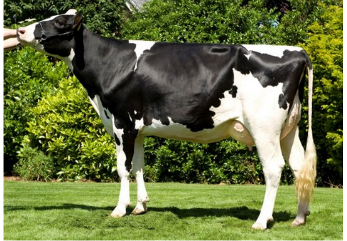
Giessen Cinderella 22 VG-85

VG-87 Bandares x VG-86 Kingboy x VG-87 Snowman x VG-85 Bolton x EX-91 Shottle x VG-89 Durham x EX-92 Encore x VG-88 Mark Cinder x EX-96 Tony x EX-94 Triple Threat