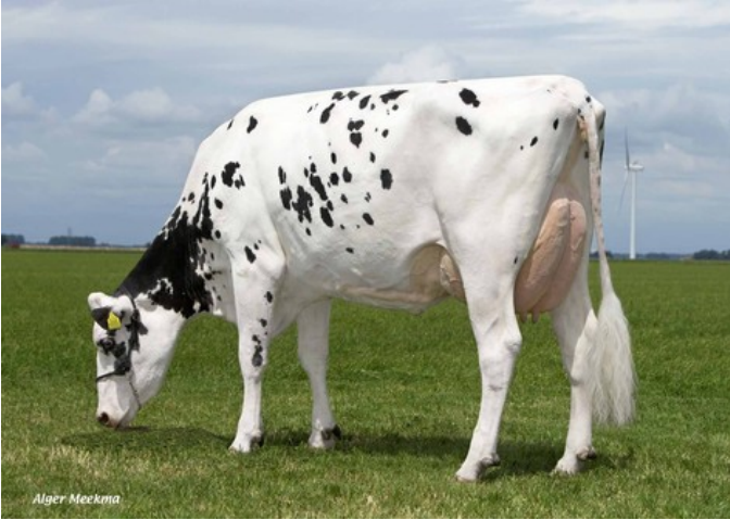
Giessen Snowman Cinderella VG-87