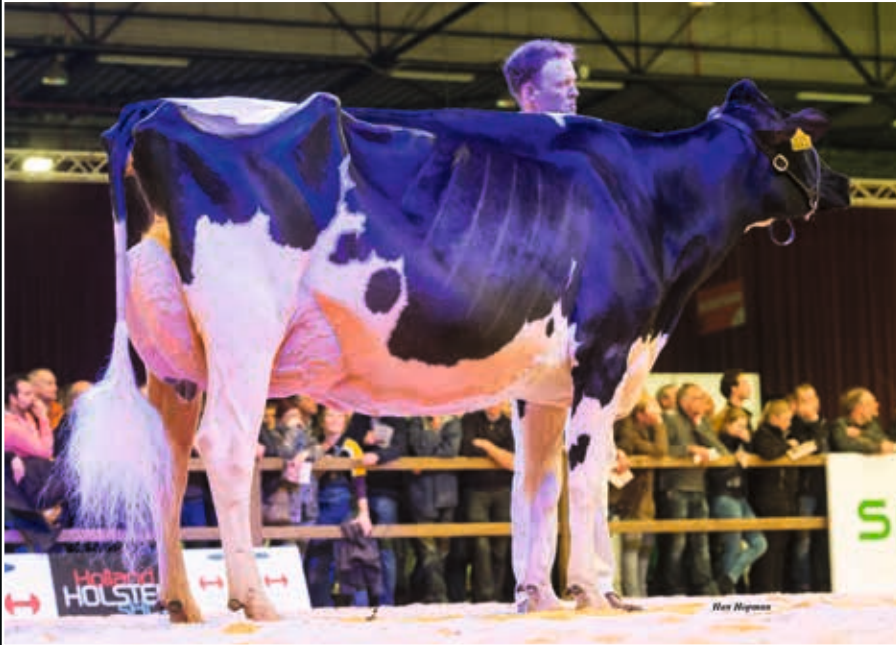
Bons-Holsteins Koba 219 EX 94 Schwester der Mutter Maternal sister to dam