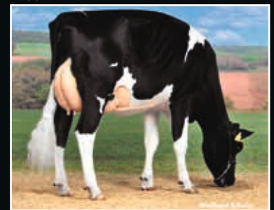
KNS Rotkäppchen VG 86 5. Mutter 5 th dam