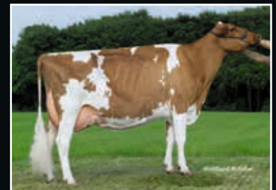
RH Maxima EX 94 Schwester der 4. Mutter Maternal sister to 4 th dam