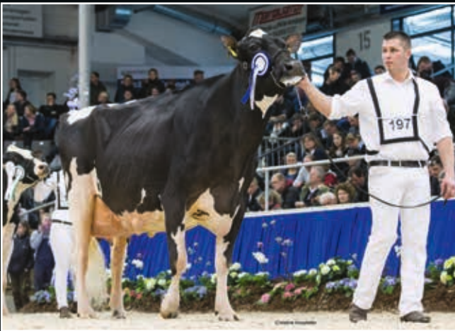
BWH Annika EX 95 Großmutter 2 nd dam