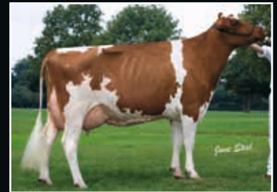
Ecstasy Faber Raquel Red PI EX 94 Ur-Großmutter 3 rd dam

Mr D Apple Diamondback RDC 507881 (Doorman x Talent)