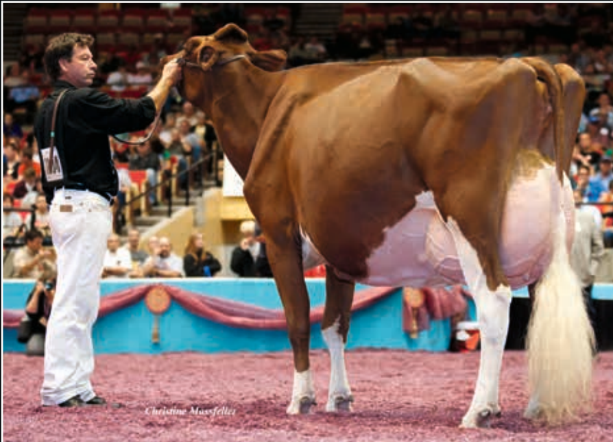
KHW Regiment Apple Red EX 96 Ur-Großmutter 3 rd dam