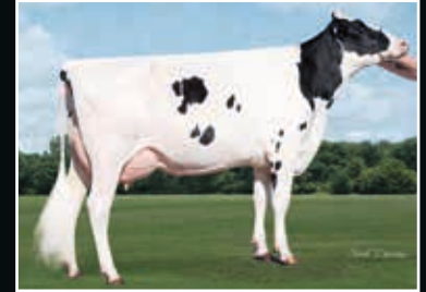
De-Su Galaxy VG 85

Schwester der 4. Mutter Maternal sister to 4 th dam