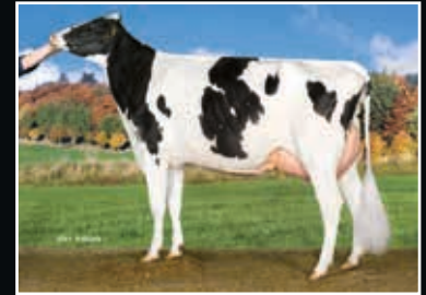
Tirsvad Bookem Nessie VG 89