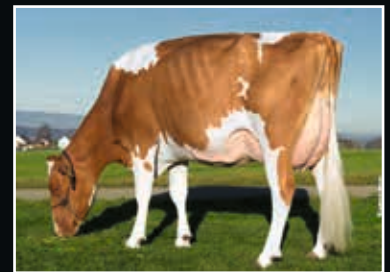
Schrago Dreamdate India EX 91