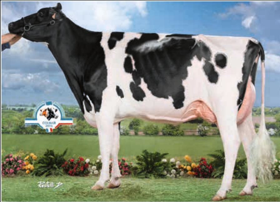
Hermine Tual VG 85