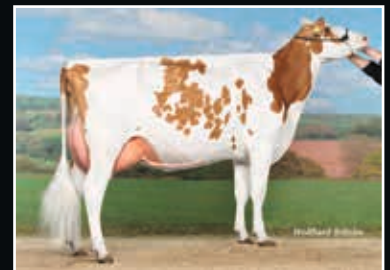
Vidia Demello Ravisante EX 91 Aus der Kuhfamilie Same family

Cycle McGucci Jordy-Red 889496 (McGucci x Gold Chip)