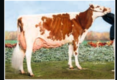
Miss Apples Aleda Red EX 94 Vollschwester der Mutter Full sister to dam