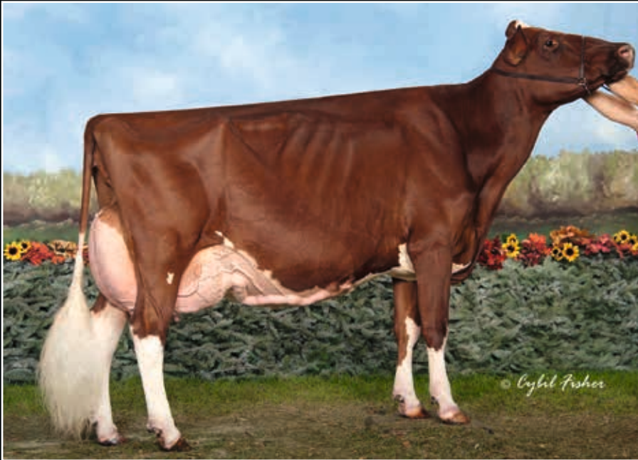
KHW Regiment Apple Red EX 96