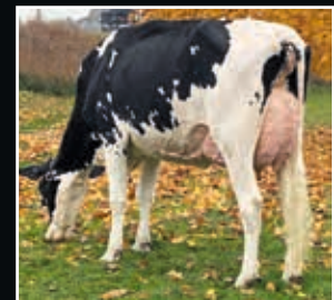
Budjon-Vail Sebiscuit VG 88 Mutter Dam

Farnear Altitude-Red-ET US 3128013348 (Arvis x McCutchen)