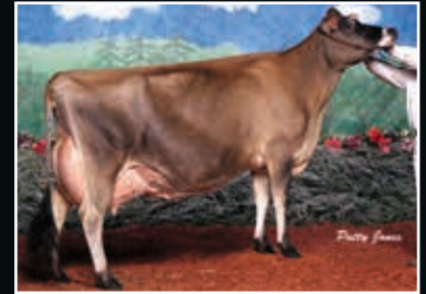
Jiff Little Minnie EX 96