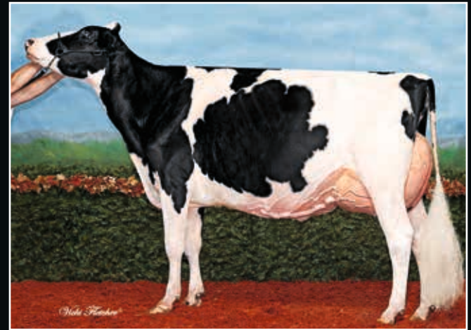
Robrook Goldwin Cameron EX 95