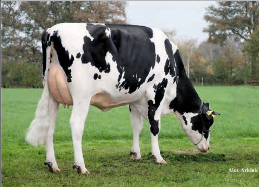
Manders Dellia 8 GP 84