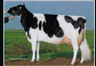
ViG Mandy EX 90 Ur-Großmutter 3 rd dam