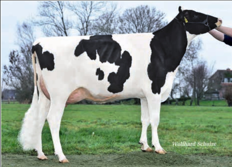
WI Beemer Felli VG 87 Großmutter 2 nd dam