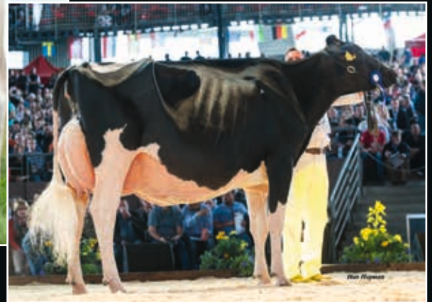
Bons-Holsteins Ella 192 EX 93 Großmutter 2 nd dam

Blondin Thunder Storm 508999 (Jacoby x Beemer)