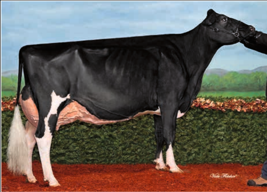
Comestar Lau Damion EX 94 Ur-Großmutter 3 rd dam