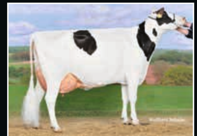
ViG Sanchez Mia EX 91

Schwester zum Verkaufstier Maternal sister