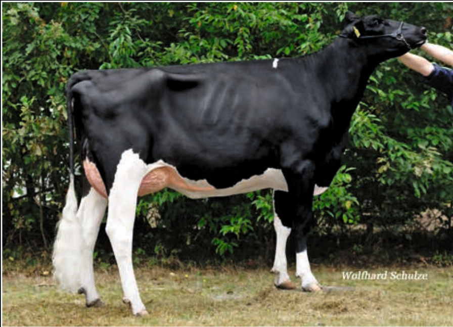
WEH Quintina VG 86 Ur-Großmutter 3 rd dam