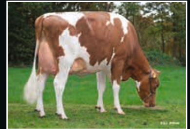
Schrago Isabella VG 87