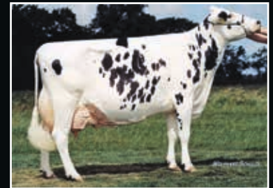
Tarona EX 96

Vollschwester der Mutter Full sister to dam