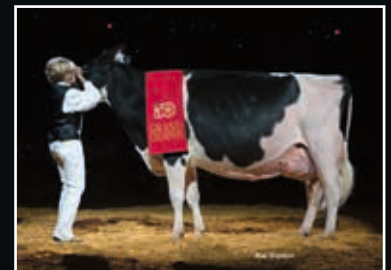
Sheeknoll Durham Arrow EX 96 Großmutter 2 nd dam