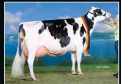
CTS Tarina EX 94 Aus der Kuhfamilie Same family

Woodcrest King Doc 508604 (Kingboy x Mack)