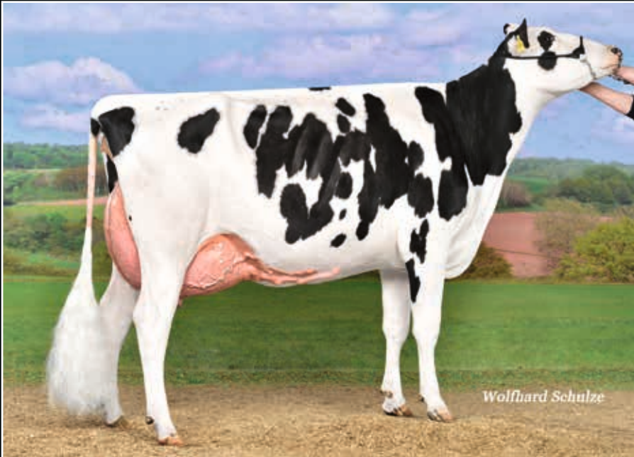
Fsh Tadema VG 88 Mutter Dam