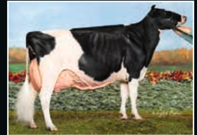
Sheeknoll Durham Arrow EX 96 Großmutter 2 nd dam