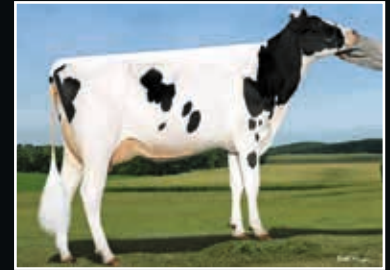
Sandy-Valley Itspossible VG 85 Ur-Großmutter 3 rd dam