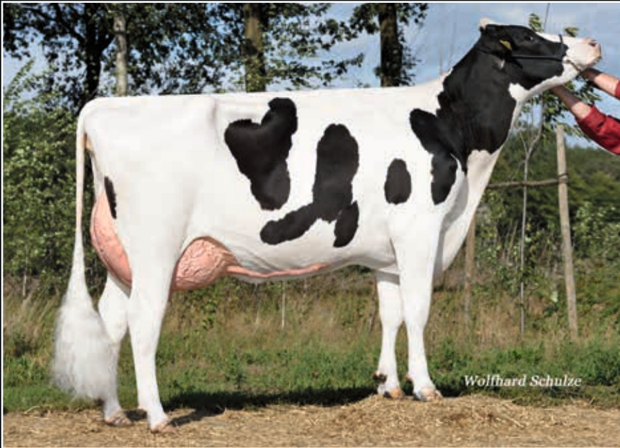
Itsprofitable VG 85 Großmutter 2 nd dam