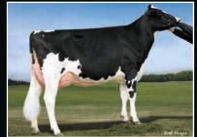
BVK Atwood Abbatha EX 90 Ur-Großmutter 3 rd dam

Our-Favorite Upgrade 509134 (Crush x Atwood)