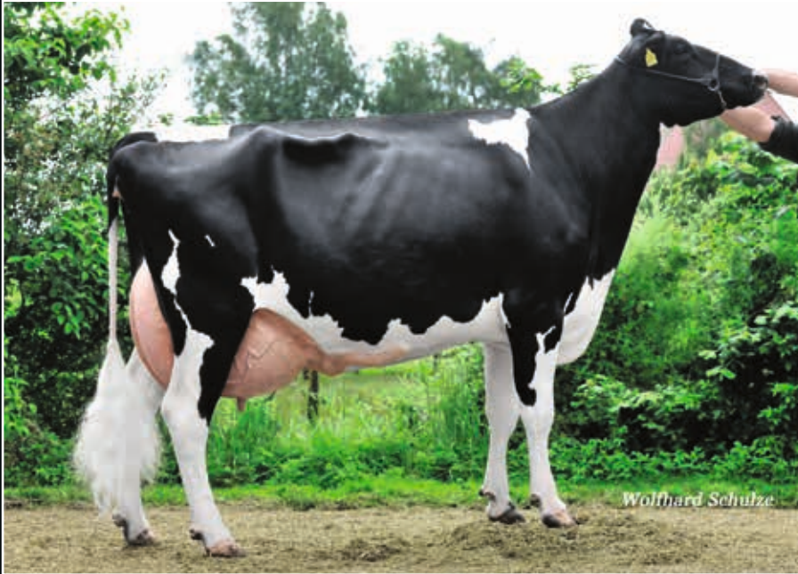
Mars Bliss EX 91 Mutter Dam