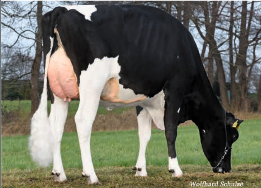
HMO Kora VG 85 (v. Superhero) Schwester der Mutter Maternal sister to dam