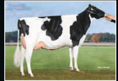
GHO Cloud No. 9 EX 90 Großmutter 2 nd dam