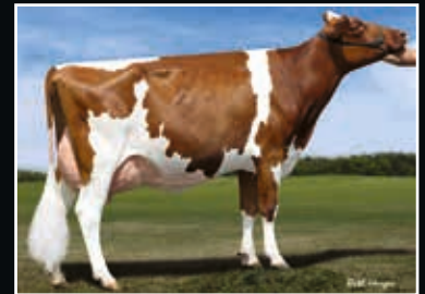
Ms Talent Applicable EX 92

Vollschwester der Mutter Full sister to dam