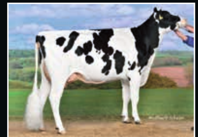
De-Su Georgia P GP 84 Großmutter 2 nd dam