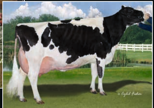
Hillcroft Leader Melanie EX 96 4. Mutter 4 th dam

Lirr-Drew Dempsey 889109 (Goldwin x Derry)