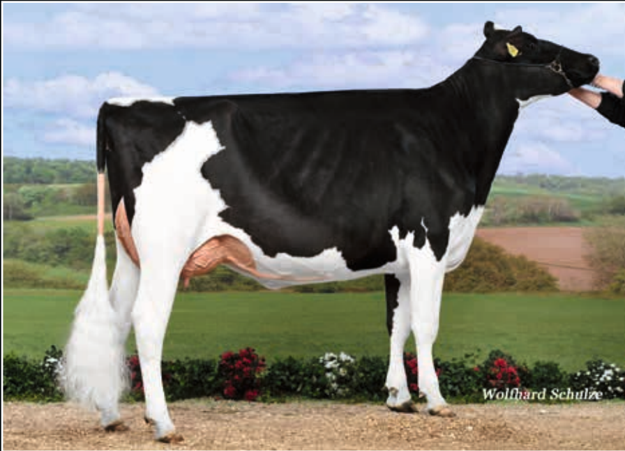
GHO Chanel VG 87 Mutter Dam