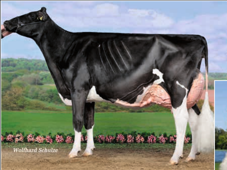
Fux Sambucca EX 94 Mutter Dam

Gen-I-Beq September Sacha VG 89 Ur-Großmutter 3 rd dam