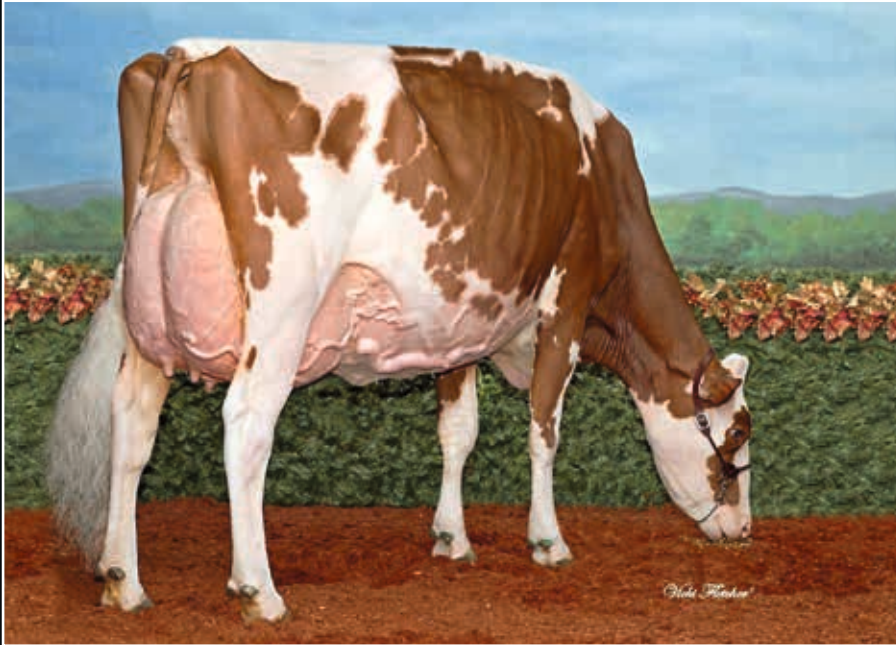
Miss Apple Snapple-Red EX 96 Vollschwester der Mutter Full sister to dam