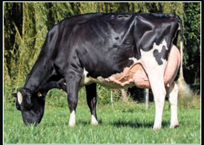
Carf Emeraude EX 94 4. Mutter 4 th dam