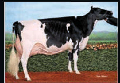
Jacobs Lautherity Loana EX 97 Aus der Kuhfamilie Same family