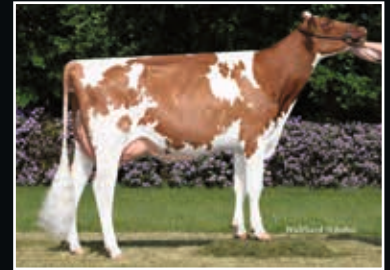
ALH Alonka VG 85

Vollschwester der Mutter Full sister to dam