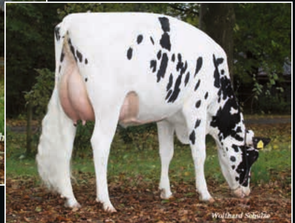
MOK Raja VG 89 Ur-Großmutter 3 rd dam