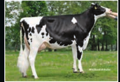
HMO Uno Kira EX 90 Ur- Großmutter 3 rd dam