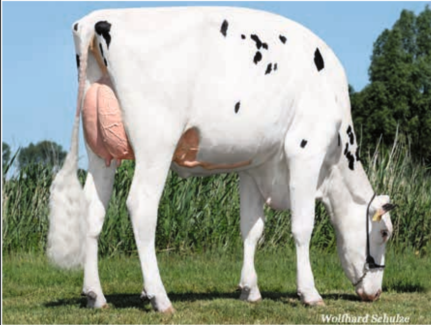
ViG Angelina VG 86 Mutter Dam