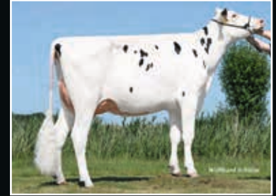
ViG Angelina VG 86 Mutter Dam