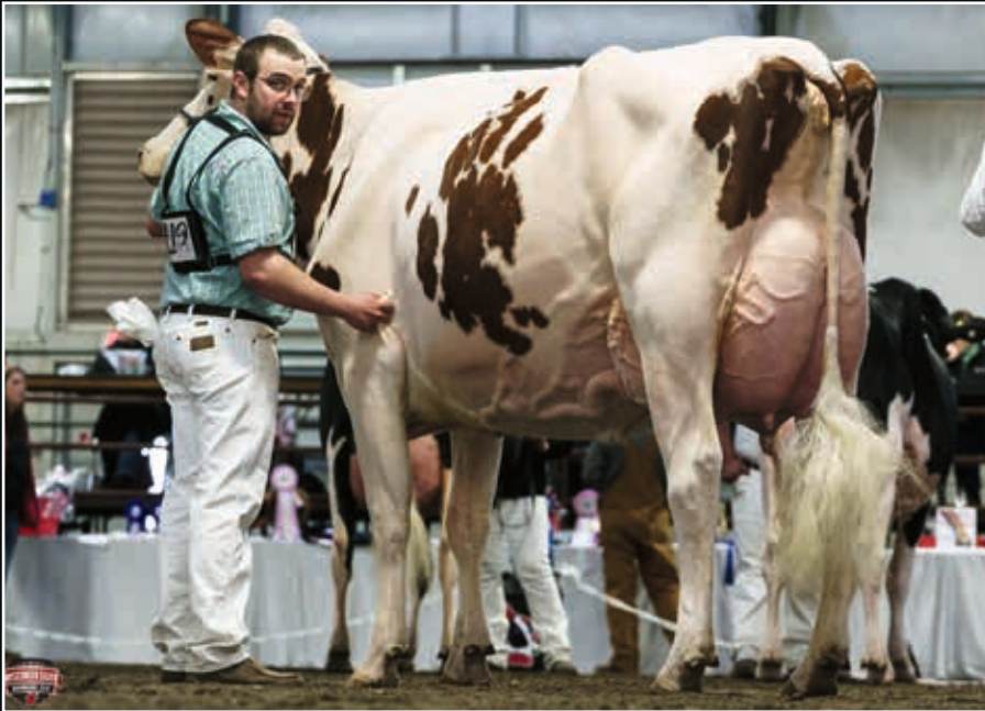
Ms Pottsdale DFI Tang Red EX 94 Mutter Dam