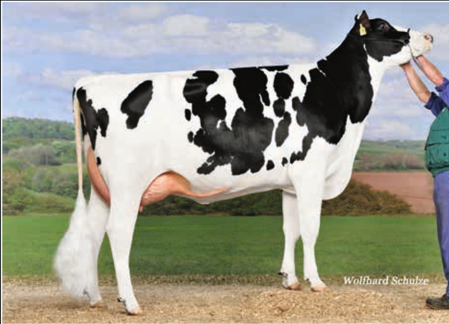
RR Elisa-Marie VG 86 Großmutter 2 nd dam