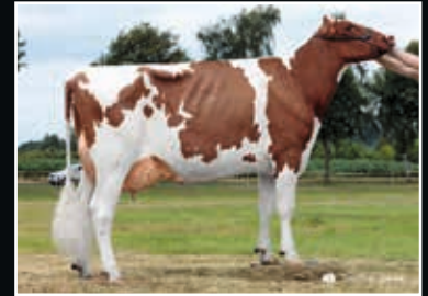
Rachel P EX 90 Großmutter 2 nd dam