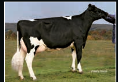
Cookiecutter GLD Holler VG 88