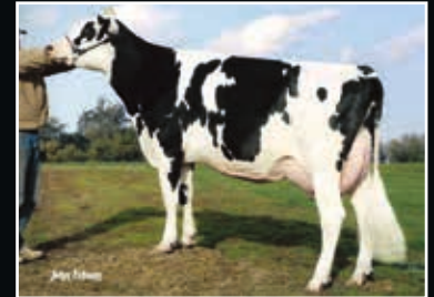
De-Su Oman 6121 VG 86 Vollschwester der 6. Mutter Full sister to 6 th dam