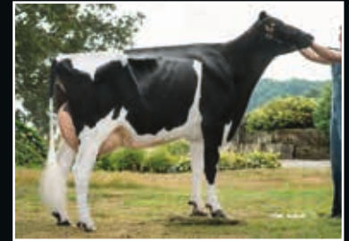
Maybelline Tual VG 85