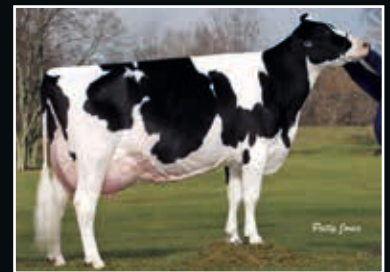
Ernest-Anthony SD Tobi EX 96 6. Mutter 6 th dam

Lindenright Moovin RC 509297 (incl. ETN) (Avalanche x Bradnick)