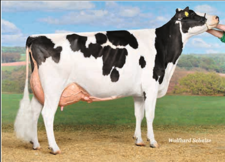
ViG Starleader Grace EX 93