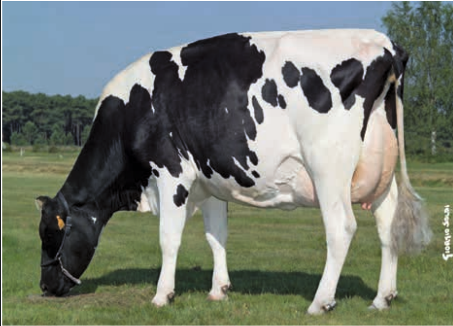
Radieuse EX 91 Stammkuh 9 th dam