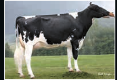
Farnear-TBR Bailey VG 87 Großmutter 2 nd dam