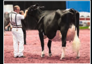
Stone-Front Iron Pasta EX 96 4. Mutter 4 th dam