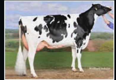
RR Eluisa VG 89 Ur-Großmutter 3 rd dam