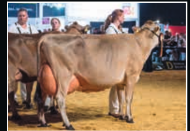
Nelly EX 90 Mutter Dam

River-Valley Chrome 409781 (Critic-P x Celebrity)