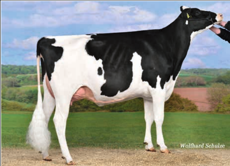
Dirty Rae VG 87 Mutter Dam