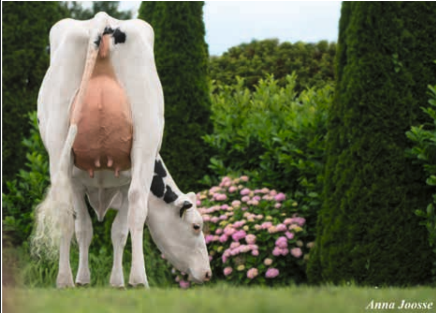
HC Archrival Arienne VG 89 Großmutter 2 nd dam