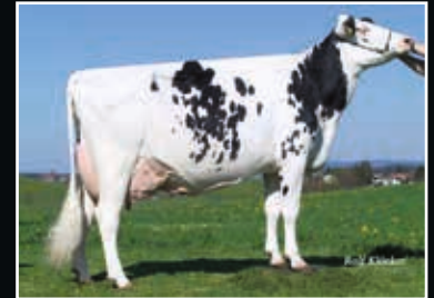
EHR Esmeralda EX 93 Großmutter 2 nd dam