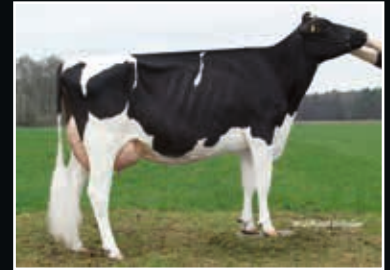
HFP Quinta VG 88 4. Mutter 4 th dam