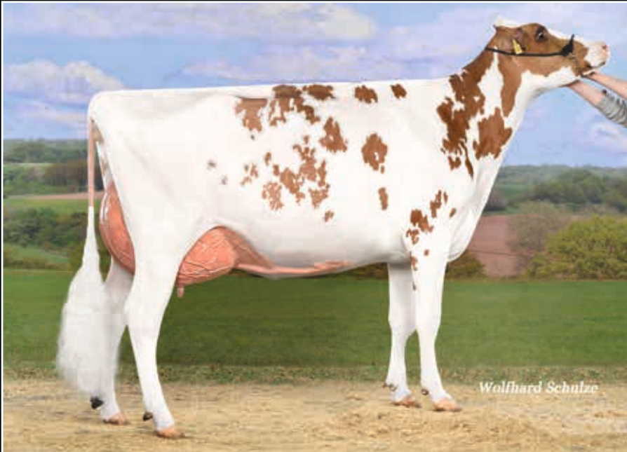
ViG Merle VG 89 Mutter Dam