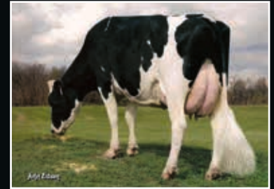
De-Su O-Man 6290 VG 86 Vollschwester der 6. Mutter Full sister to 6 th dam