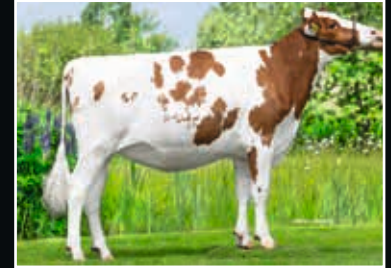
Batouwe Alishia Salva Red