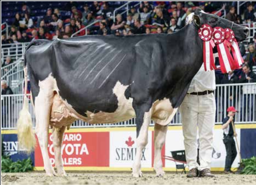
Jacobs Goldwyn Lisamaree EX 94 Großmutter 2 nd dam