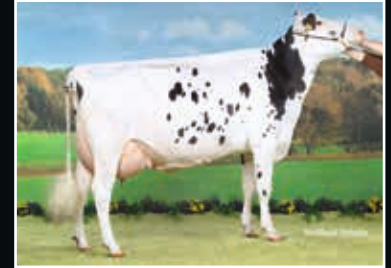
Cinderella VG 86

Vollschwester der Mutter Full sister to dam