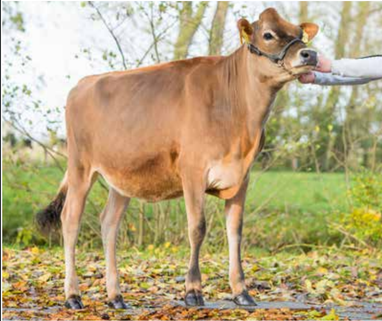
Verkaufstier Nele She sells!