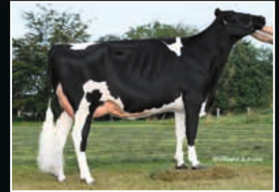
Jacobs Diamondback Lisa VG 87 Mutter Dam