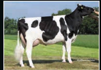
HFK Queen VG 87 Aus der Kuhfamilie same family