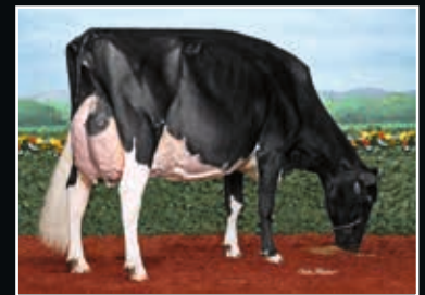
Comestar Lamadona Doorman EX 94 Aus der Familie Same family

Mr Blondin Warrior-Red 298475 (incl. ETN) (Avalanche x Doorman)