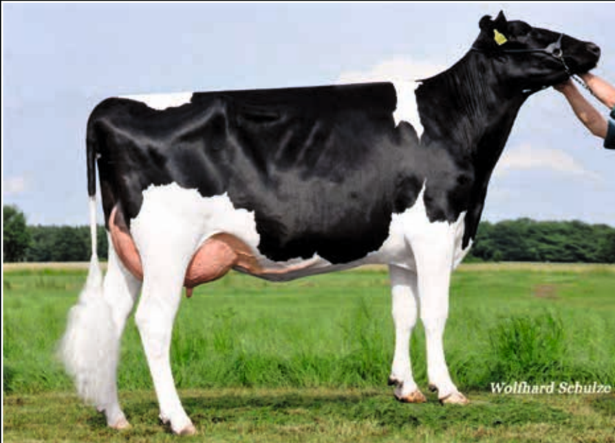
RR America RC VG 88 3. Mutter 3 rd dam