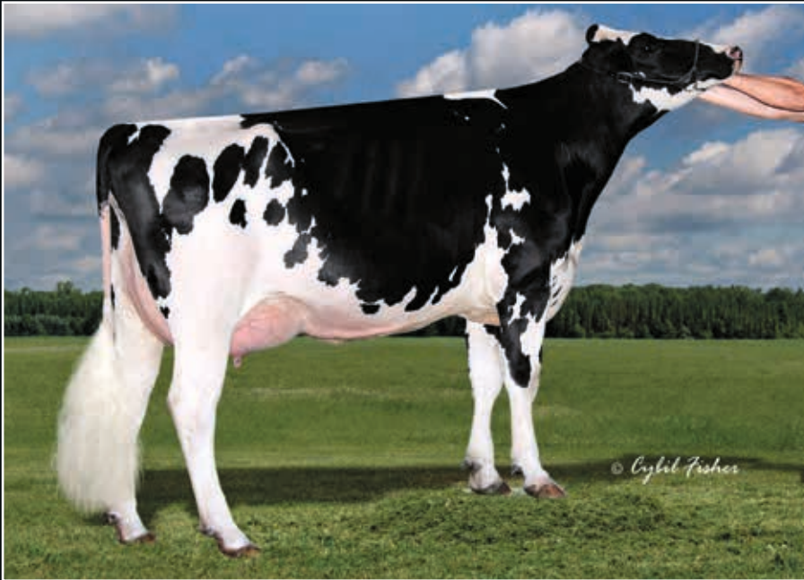
Cookiecutter Epic Hazel EX 92