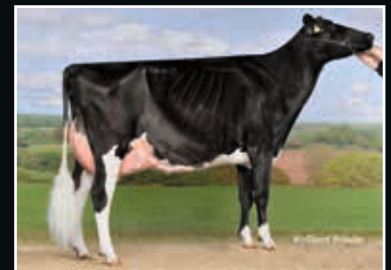
GHH Goldwin Frency VG 88 Halbschwester zur Ur-Großmutter Maternal sister to 3 rd dam