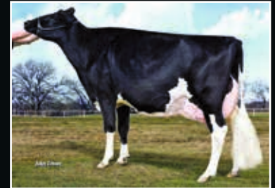
Ms Apples Angel EX 94 Großmutter 2 nd dam