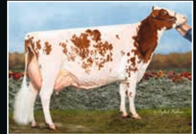
Blondin Redman Seisme EX 97 Aus der Kuhfamilie Same family