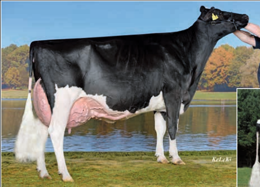
Loh Lissy EX 93 Mutter Dam