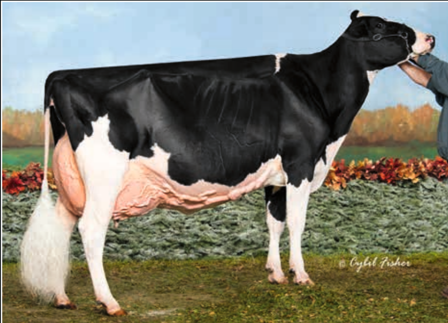
Blondin Goldwyn Subliminal EX 96 Großmutter 2 nd dam