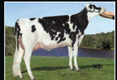
Gen-I-Beq Snowman Akilia VG 88 4. Mutter 4 th dam