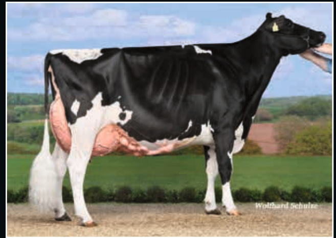
BWH Annika EX 95 Großmutter 2 nd dam

Petit Coeur Darlingo 833192 (Doorman x Gold Chip)