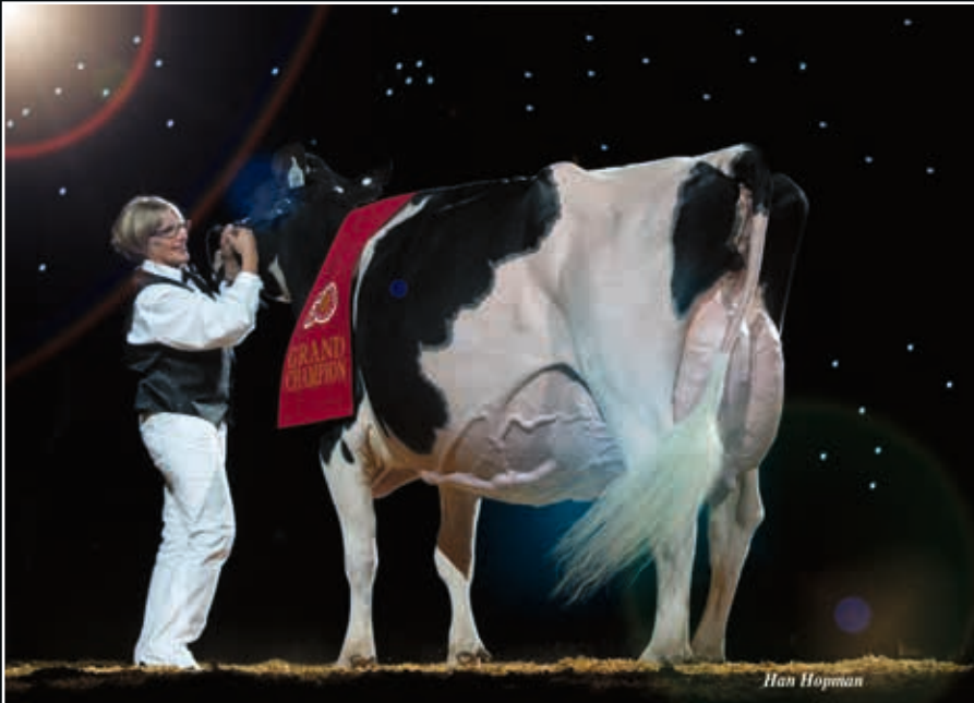
Sheeknoll Durham Arrow EX 96 Großmutter 2 nd dam