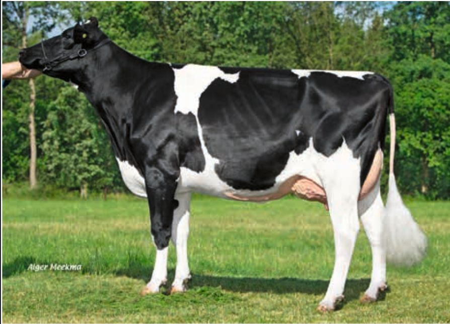
NRP Alisha RDC VG 86