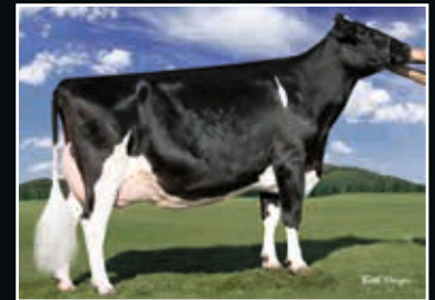
Regancrest Durham Barbie EX 92 Vollschwester der 4. Mutter Maternal sister to 4 th dam

Siemers Lambda Haniko 508946 (Lambda x Monterey)