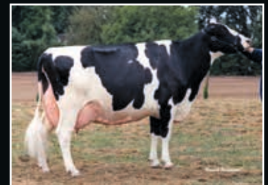
Hanoverhill Tony Rae EX 96 6. Mutter 6 th dam

Mr D Apple Diamondback RDC 507881 (Doorman x Talent)