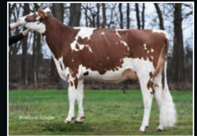
Nohl Avala Vray VG 87 Mutter Dam

Godewind RDC 151518 (Gold Chip x Sanchez)