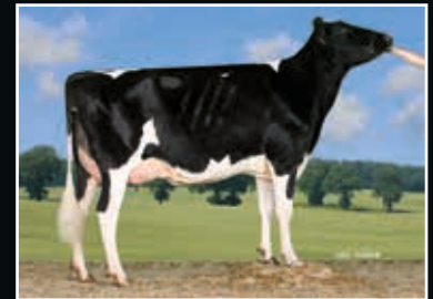
Tirsvad Gibor Netto EX 91