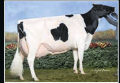
EK Oseeana Ambrosia EX 96 Vollschwester der Großmutter Full sister to 2 nd dam