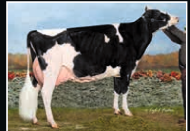
BVK Atwood Arianna EX 94 4. Mutter 4 th dam

Lindenricht Moovin RC 509297 (incl. ETN) (Avalanche x Bradnick)