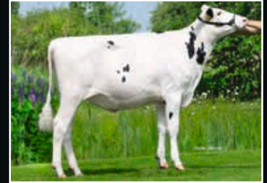
UPS K&L Adeena RDC Mutter Dam