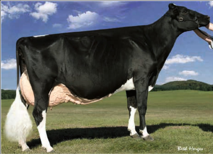
Stone-Front Iron Pasta EX 96 4. Mutter 4 th dam