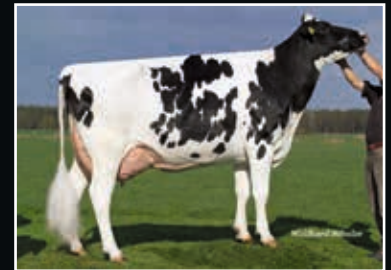
RR Elisa EX 90 4. Mutter 4 th dam