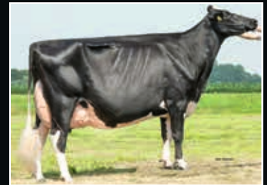
Bons Holsteins Koba 191 EX 94 Schwester der Ur-Großmutter Maternal sister to 3 rd dam

Croteau Lesperron Unix 507794 (Numero Uno x Domain)