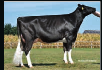
Nova C Pandora VG 86 Mutter Dam

Duckett Crush Tattoo 508952 (Crush x Gold Chip)