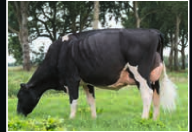
Bons-Holsteins Koba 209 EX 91 Sid x Bons-Holsteins Koba 191