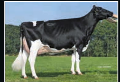
A-L-H Australia RDC VG 87