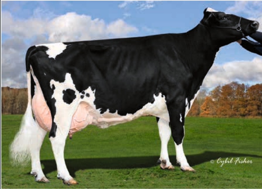
Clear-Echo Ramos 1200 EX 94