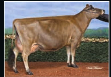
Select-Scott JW Miss Minnie EX 92