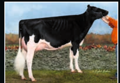
MS Im an Angel EX 92 Schwester der Mutter Maternal sister to dam

Woodcrest King Doc 508604 (Kingboy x Mack)