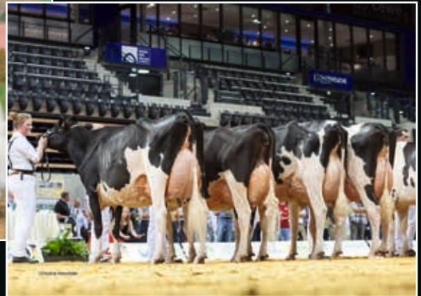
Hirondelle EX 92 Mutter Dam