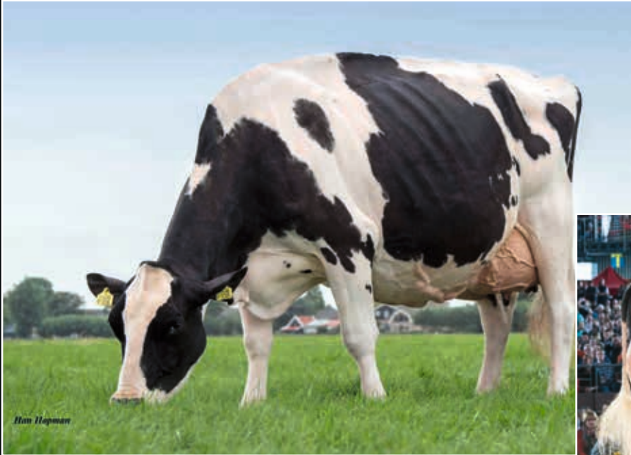
Bons-Holsteins Ella 158 EX 94 Ur-Großmutter 3 rd dam