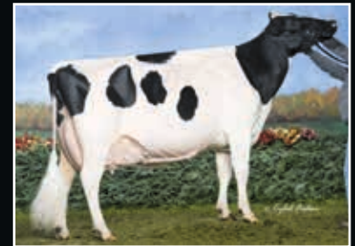
Ernest Anthony Aphrodite EX 95 Vollschwester der Großmutter Full sister to 2 nd dam