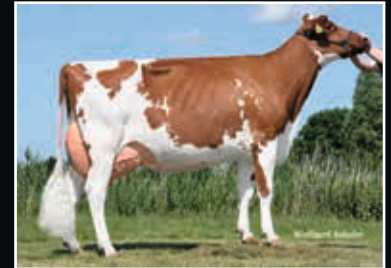
ViG Mila VG 88 Talent x RH Maibrüt