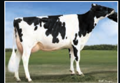
Clear-Echo M-O-M 2150 VG 87

Schwester der 4. Mutter Maternal sister to 4 th dam