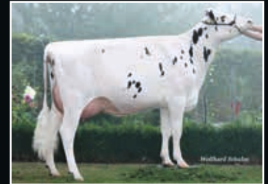
GHH Delta Felicity VG 87 Ur-Großmutter 3 rd dam