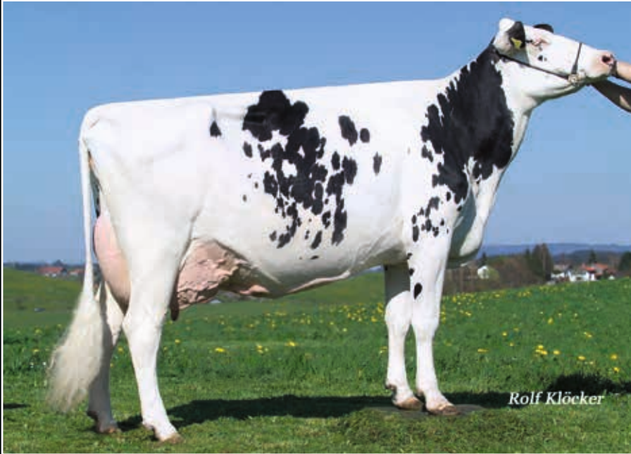
EHR Esmeralda EX 93