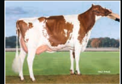
Anderstrup Nugget Dana Red VG 88