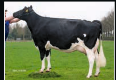
Manders Dellia 1 VG 87