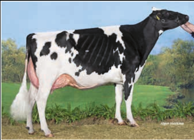
JK Eder DG Esmeralda EX 92 Ur-Großmutter 3 rd dam