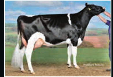
WKM Ronja VG 85 4. Mutter 4 th dam