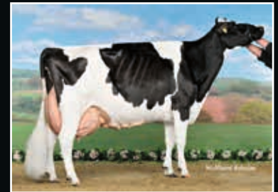
Batke Outside Kora EX 94 5. Mutter 5 th dam