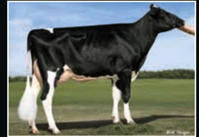
Co-Vista Atwood Desire EX 90 Großmutter 2 nd dam