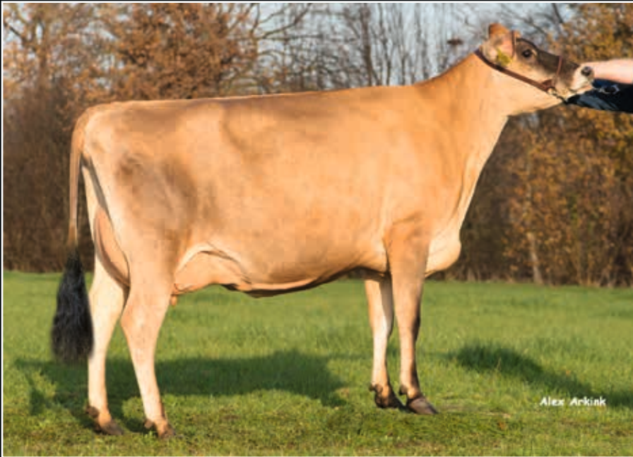
ARGH Miss Tequila VG 85