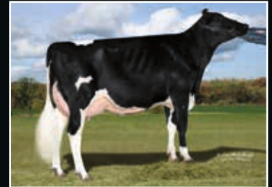
Cookiecutter MOM Halo VG 88