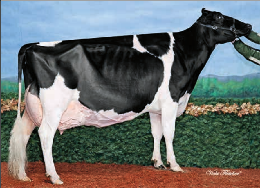
EO Siemers Ashlyns Angel EX 96 Großmutter 2 nd dam