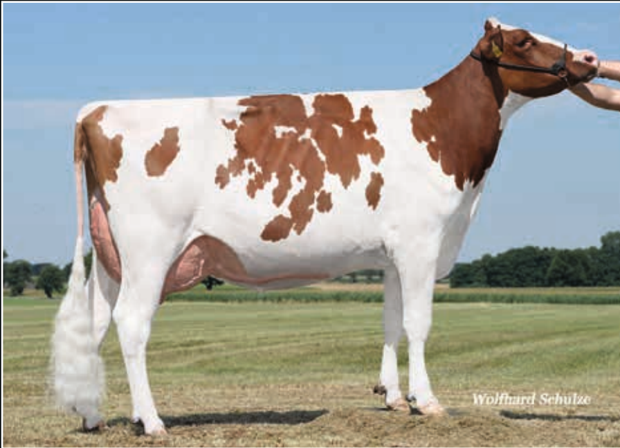
Red Apple P EX 90 Mutter Dam