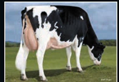
Future-Jolane Uno Hay P VG 86 4. Mutter 4 th dam