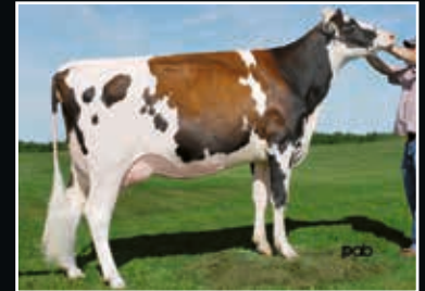
KHW-I Aika Baxter VG 89 5. Mutter 5 th dam