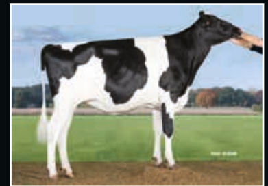
K&L OH Mabel