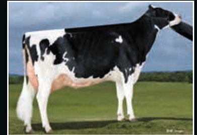
Future-Jolane Uno Hay P VG 86 4. Mutter 4 th dam