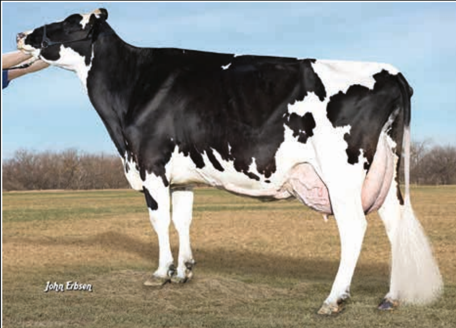
De-Su Shottle 7091 EX 90 Aus der Kuhfamilie Same family