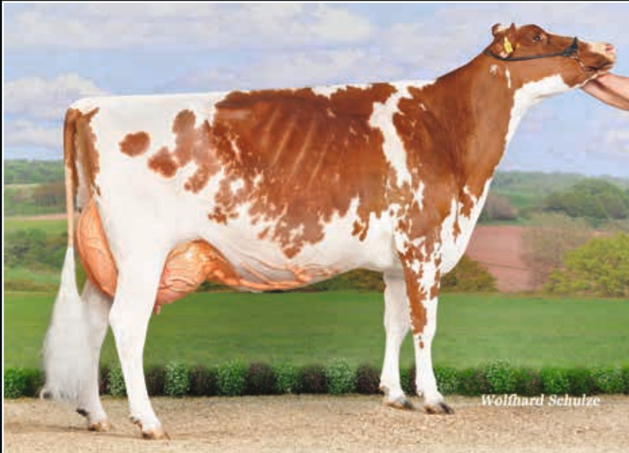
RH Maibrüt EX 92 Ur-Großmutter 3 rd dam