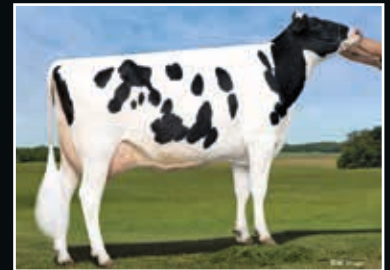
Sandy-Valley NU Precious VG 88 4. Mutter 4 th dam