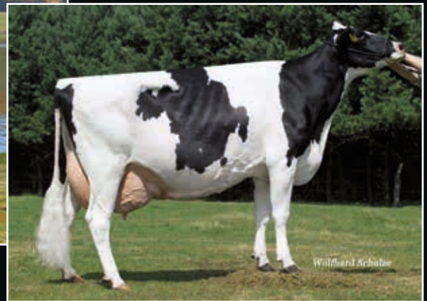
Loh Lynn EX 92 Großmutter 2 nd dam

S-S-I Mogul Reflector 508284 (Mogul x Super)