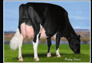
Comestar Lau Damion EX 94 Ur-Großmutter 3 rd dam