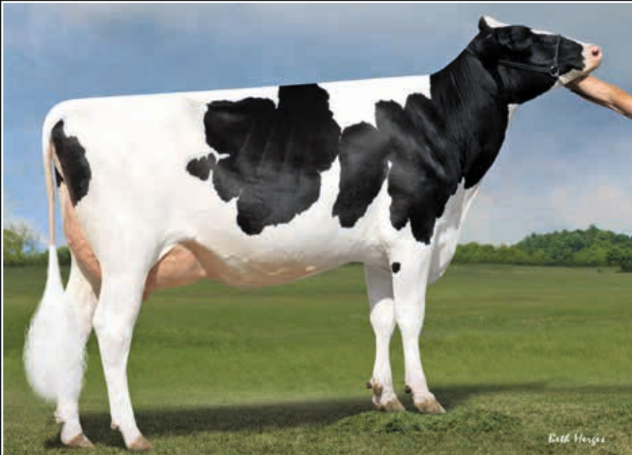
Future-Jolane Haylee P VG 85 3. Mutter 3 rd dam