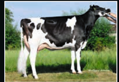
Zeedieker Fever Candy EX 90 Ur-Großmutter 3 rd dam

Cycle McGucci Jordy-Red 889496 (McGucci x Gold Chip)