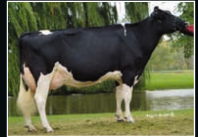
C Alanvale Inspiration Tina EX 95 7. Mutter 7 th dam