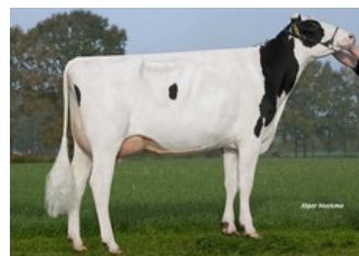
FG Feline VG-86