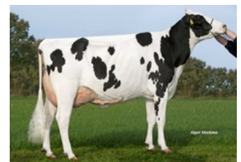
FG Policy VG-88