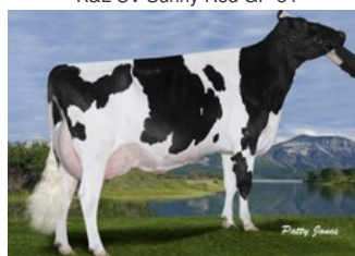
Gen-I-Beq Goldwyn Secret RC VG-87