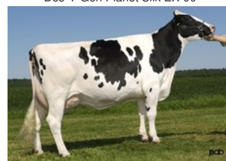
Glen Drummond Splendor VG-86

Rainow x Rubels-Red x GP-84 Salvatore Rc x Rubicon x GP-83 Cashcoin x VG-87 Snowman x EX-90 Planet x VG-85 Bolton x VG-87 Goldwyn x VG-87 Durham