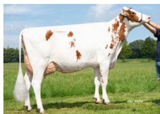
K&L SV Sunny Red GP-84