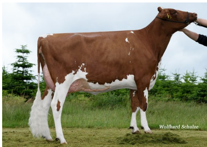
BHA Amore Red VG-89

Mcdonald-P-Red x VG-85 Solito Red x VG-89 Diamondback RDC x EX-91 Godewind x VG-87 BURAN x VG-87 Glacier-Red x VG-85 Reno