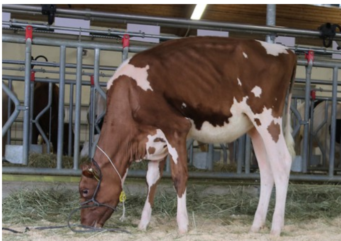
BHA All You Want-Red

BHA ALL YOU WANT RED DE 818115360 GEB. 03-03-2022