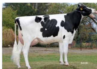
KHE Isolde VG-87