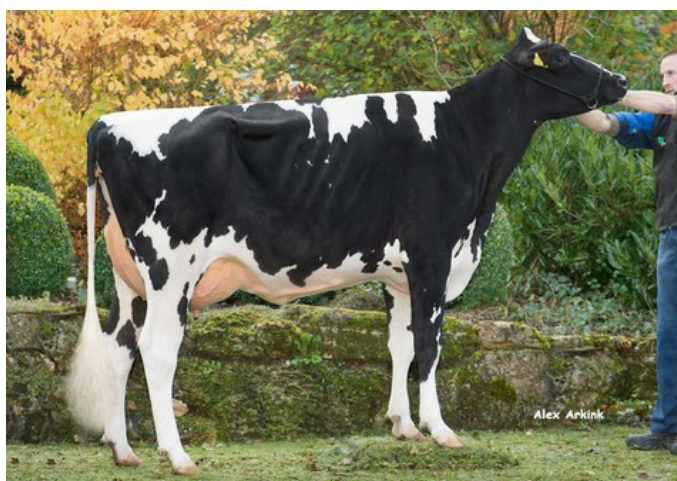
Missy P RDC