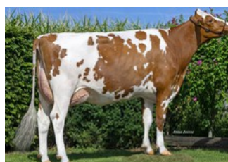
Miss Spark Red, Spark x Missy P RDC