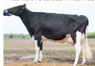
Wilder Meta VG-86

Cartoon P Red x VG-85 Broker PP x Hotspot P x VG-87 Mission P RDC x Penley x VG-86 Boss x VG-86 Shamrock x VG-87 Perform x EX-90 Goldwyn x VG-88 Morty