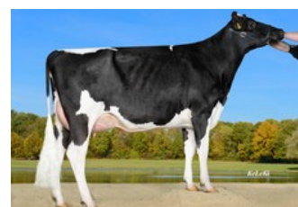
Wilder Melle VG-85, Boss x Wilder Meta