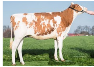
Wilder Smile Red GP-84