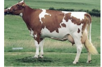
Apina Massia 14 VG-85

Battlecry x GP-84 Brekem RDC x VG-87 Snowman x EX-90 Shottle x EX-90 Lentini x VG-85 Tulip x VG-86 Andries x VG-85 Jubilant RF