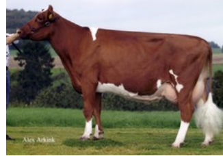
Apina Massia 21 EX-90