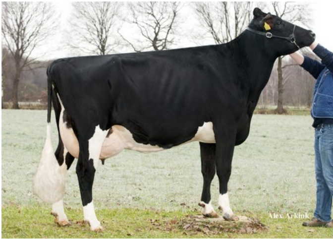
Apina Massia 102 RDC EX-90