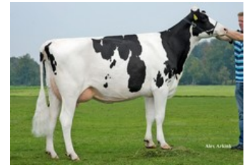
Sanderij Massia Sneeuw witje RDC VG-87