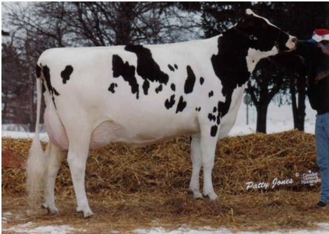
Glen Drummond Aero Flower VG-88