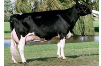
Snow-N Denises Dellia EX-95

VG-85 Supershot x VG-85 McCutchen x VG-87 Altalota x VG-87 Planet x EX-92 Bolton x VG-87 Forbidden x VG-89 BW Marshall x VG-87 Rudolph x EX-90 Tesk x EX-95 Chief Mark