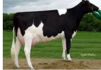
Orthoapple Marshall Alia VG-89