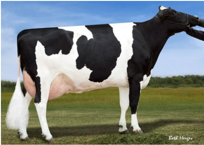
Sandy-Valley Bolt Sheila EX-92