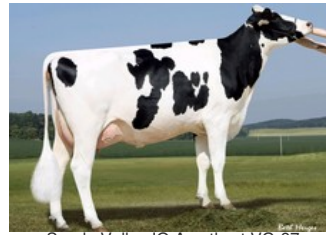
Sandy-Valley IO Amethyst VG-87