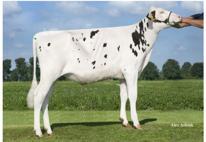
Dyment DG Earn So PP RDC GP-83

Supershot x GP-83 Earnhardt P x GP-82 Colt P x VG-85 Socrates x VG-87 Goldwyn x VG-87 Durham x VG-86 Formation x VG-88 Aerostar x EX Enhancer x EX Christopher